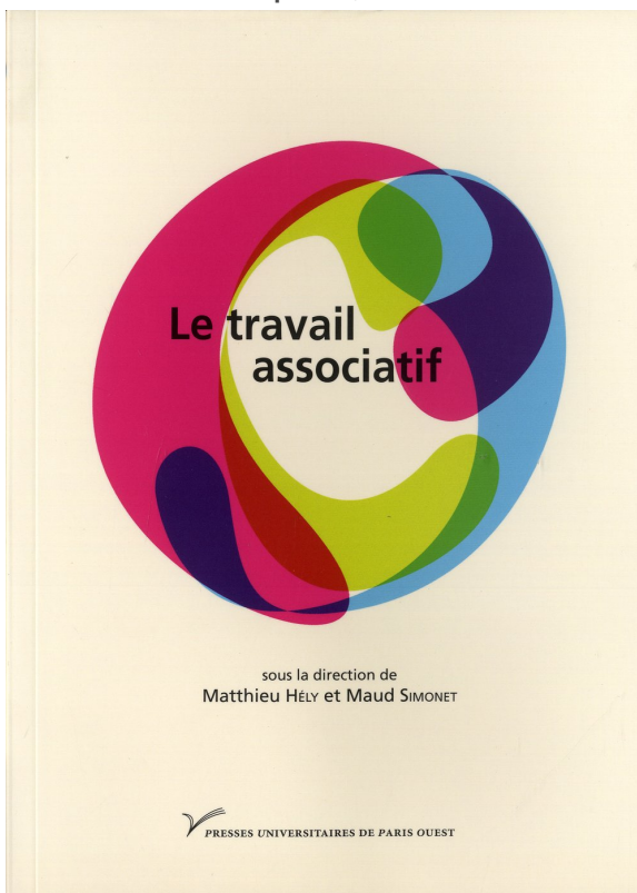
Le travail associatif , avec Maud Simonet, Presses Universitaires de Nanterre, 2013.

Les métamorphoses du monde associatif , Presses Universitaires de France, « Le lien social », 2009 (1ère édition).